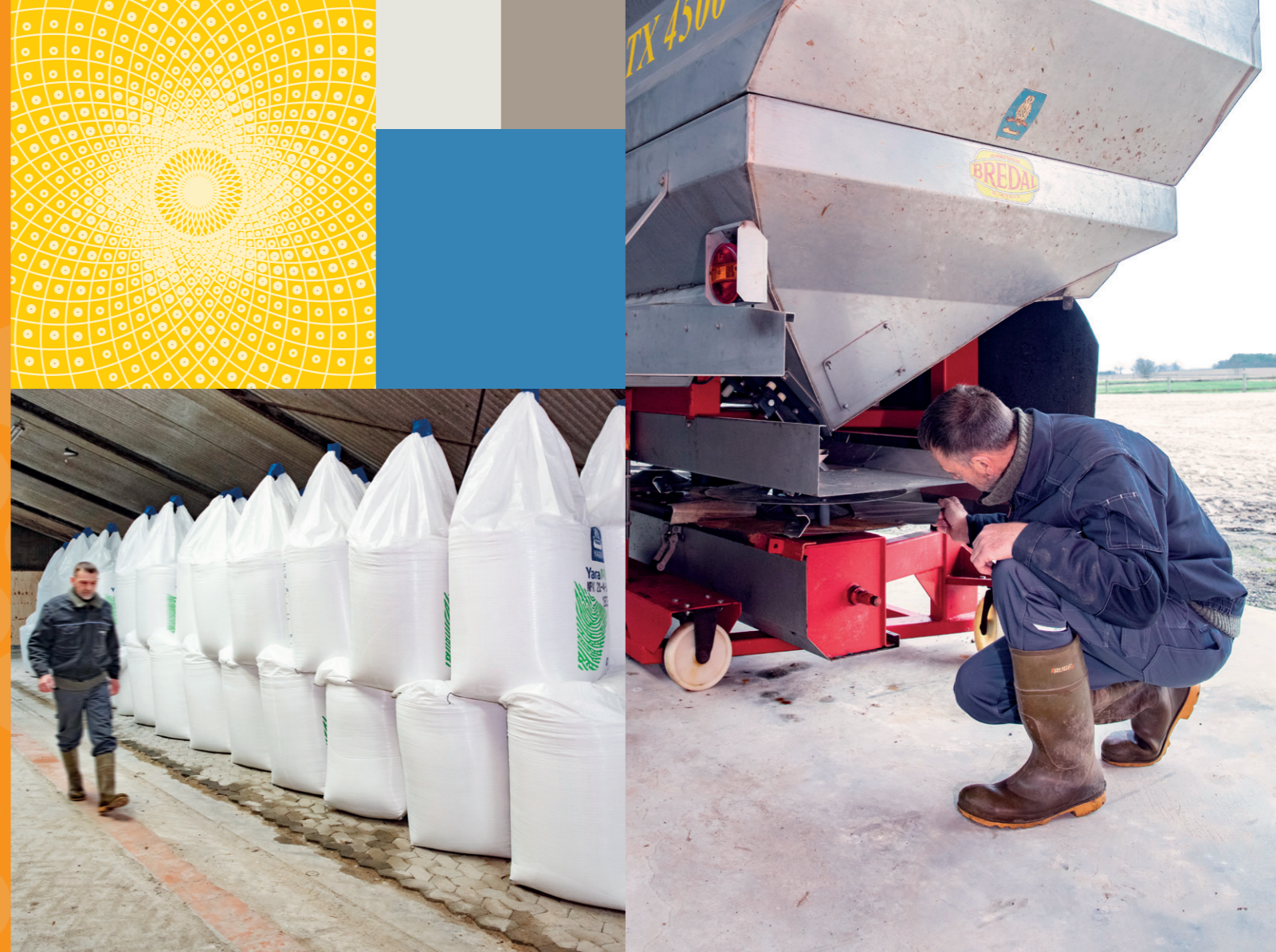
BONDERUP TAGER AL SIN GØDNING hjem i storsække, blandt andet fordi de er nemme at håndtere og opbevare.

Tildelingen af fosfor på Bonderup på Midsjælland er tilrettelagt med det mål at hæve fosfortallet over tid. Holdningen på stedet er i øvrigt, at det kan svare sig at betale ekstra for gødning af god fysisk kvalitet. Derfor bruger man Yara gødning.