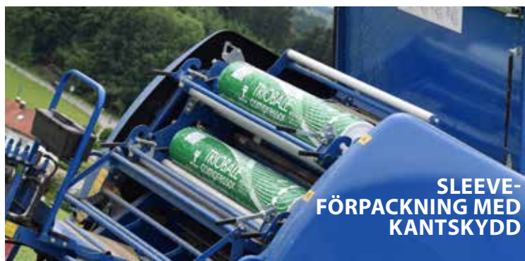
SLEEVE-FÖRPACKNING MED KANTSKYDD

Produktguide Hitta den bästa och mest effektiva filmen för din maskin: triowrap.se