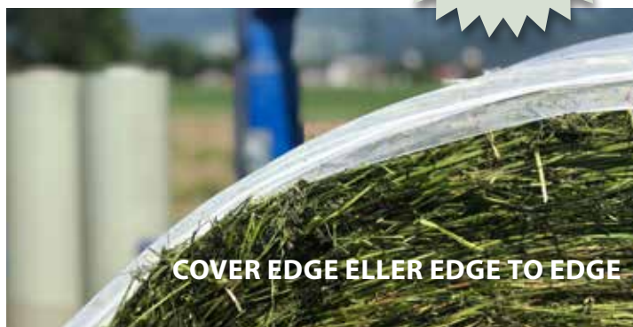
COVER EDGE ELLER EDGE TO EDGE