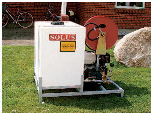
Højtryksrenser, tagrenser, kloakspuler.