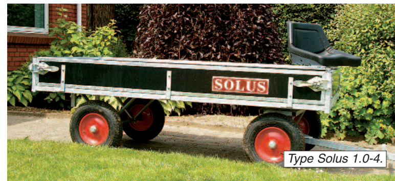
Type Solus 1.0-4.

med støttehjul, stålpladebund og lygteføring. Kan også leveres med bremse for indregistrering.