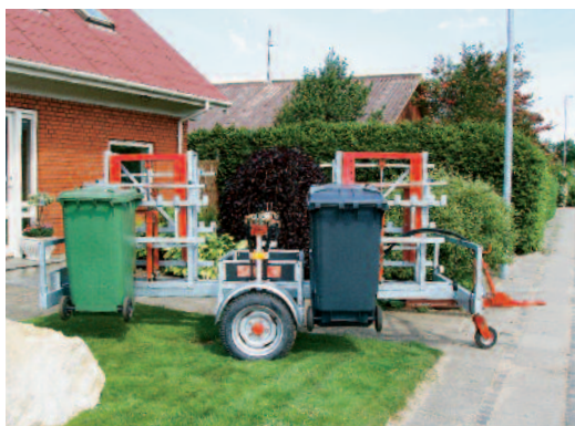
Renovationsvoan med 4 lifte.