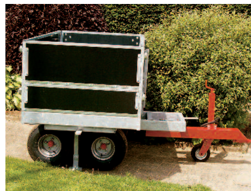
Kirkegårdsvoan, 1500 kg nyttelast. Boogie er ekstra udstyr.