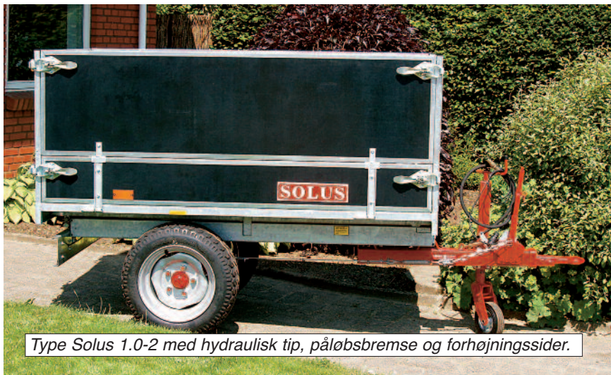
Type Solus 1.0-2 med hydraulisk tip, påløbsbremse og forhøjningssider.