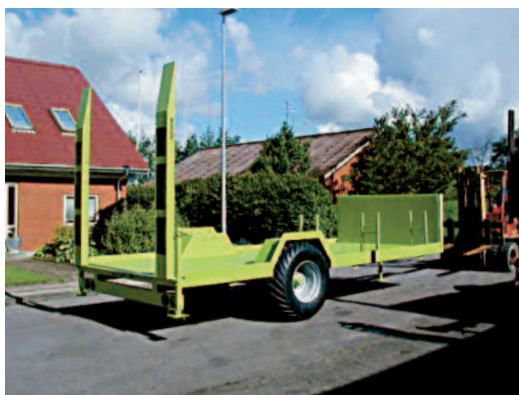
Blokvogn til transport af mini-rendegraver/læsser.