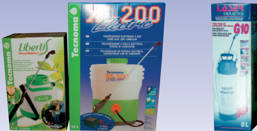
5 liters skuld sprøjte