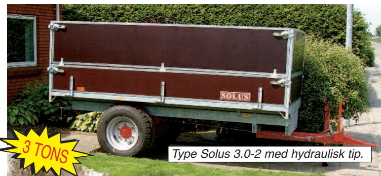
Type Solus 3.0-2 med hydraulisk tip.

er fremstillet af firkantede stålrør. Vognene er med stålbund, vandfaste finersider samt med varmgalvaniseret chassis.