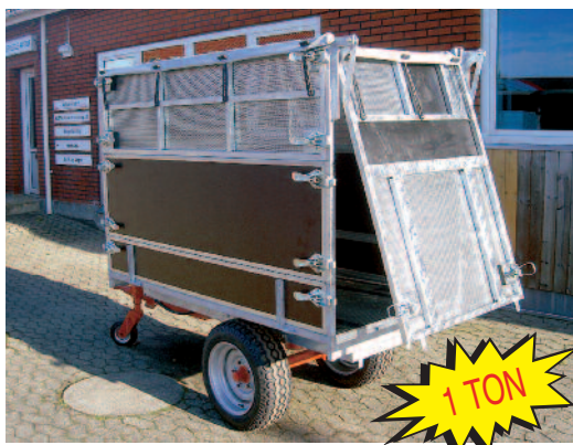
Udstyret med forhøjnings- og løvsugersider.