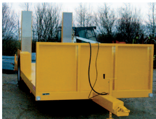
Blokvogn til transport af mini-rendegraver/læsser.