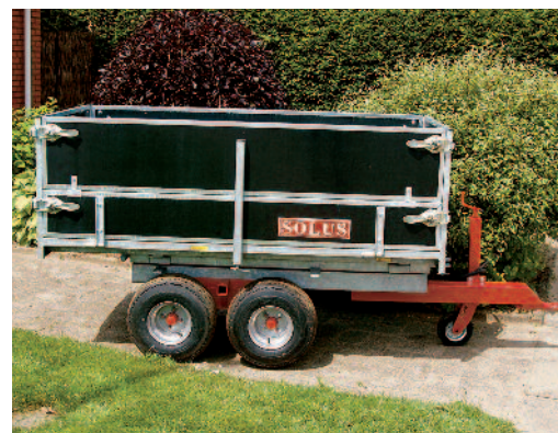
Kirkegårdsvoan med boogie.