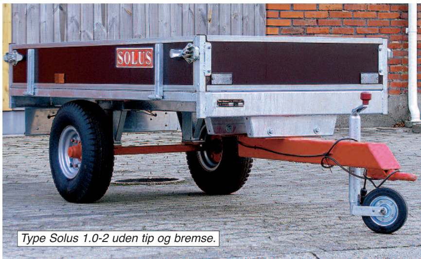
Type Solus 1.0-2 uden tip og bremse.