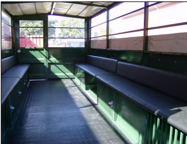
Vognen her er med polstrede langbænke.