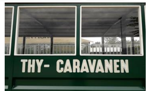
Tekst på vognen efter ønske.

Ved indgangen er der, uanset sædetype, indrettet 4 sidepladser, 2 i hver side. Stolene kan slås op og give plads til kørestole og give større frirum ved indstigning i vognen.