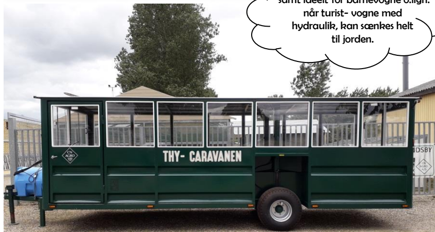
Vogn m. plexirude og fast tag

Godt for ældre og handicappede, samt ideelt for barnevogne o.lign. når turist- vogne med hydraulik, kan sænkes helt til jorden.