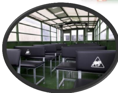
Der er mulighed for at få logo på stolerygge.