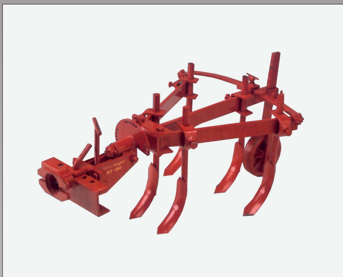
Kultivator er indstillelig og med 5 tænder.