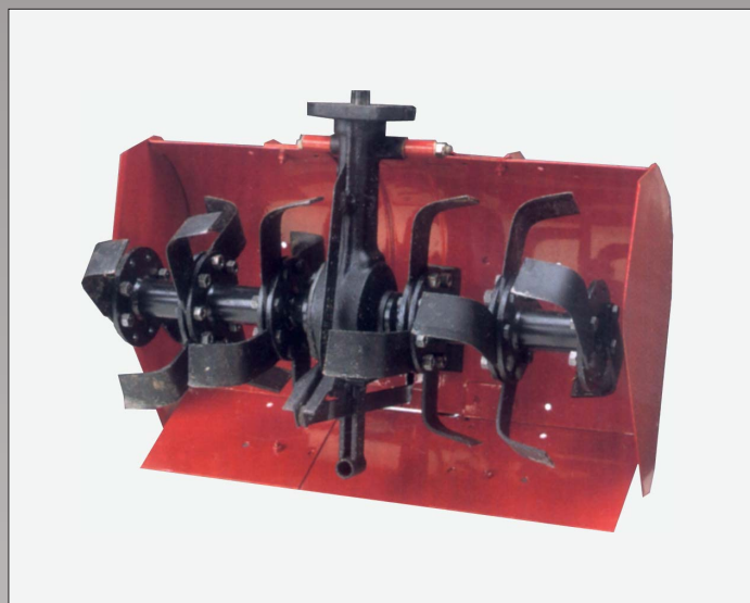
Nibbi-fræsere er konstrueret til hårdt og vedvarende arbejde hver dag. De kan alle justeres i bredden og knivene er fremstillet af kraftigt fjederstål med livslang garanti mod brud. Når bakgearet benyttes, frakobles knivene på fræseren automatisk.