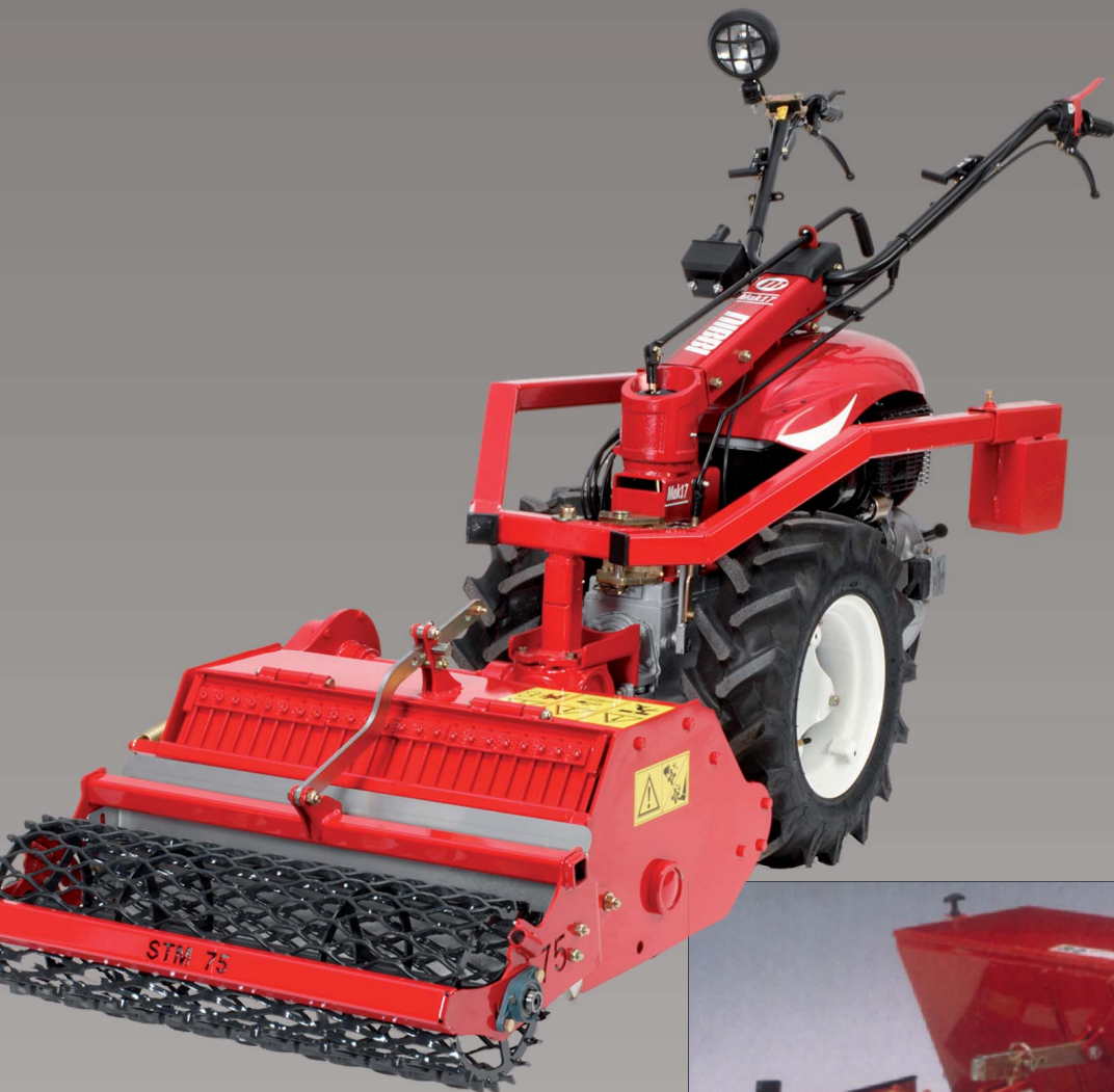
Rotorharve med gittertromle og såmaskine. Arbejdsbredde 75 cm.

Nibbi traktorer er specielt indrettet til de danske forhold. Det er samtidig den eneste traktor, hvor gearkassen er tilpasset specielt danske arbejdsforhold og danske redskaber.