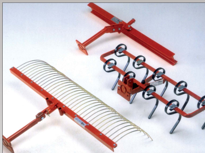
Rive 120 cm med dobbelttænder, incl. træktoj. Planérskinne, I-formet bredde 120 cm, incl. træktoj. Kultivator/Harve leveres med 9 tænder, som kan justeres, så bredden kan variere fra 55 - 95 cm.