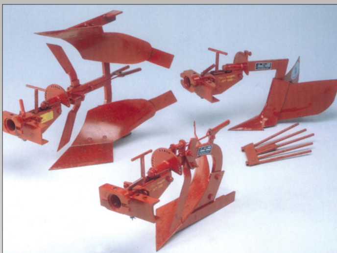
Plov, 8" enkelt eller vendeplov med universalophæng der muliggør side- og skråindstilling. Hyppeplov komplet med kartoffeloptager kan kobles direkte på ophængen.