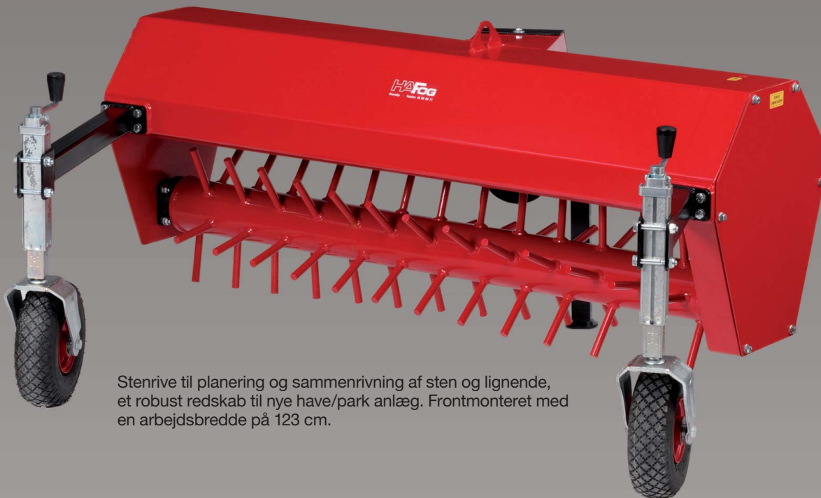
Stenrive til planering og sammenrivning af sten og lignende, et robust redskab til nye have/park anlæg. Frontmonteret med en arbejdsbredde på 123 cm.