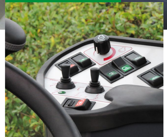
Fuld kontrol lige ved hånden

Timan 3330s kontrolpanel er udviklet i samarbejde med dem, som betjener maskinen til dagligt. Fordi fuld kontrol skal virke naturligt. Fartholder, elektronisk håndgas og Stop/Go-funktion er standard på maskinen.