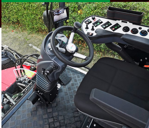
Lavt støjniveau og masser af plads

Drop høreværnet og lyt til musikken. Med kun 68 dB ved 2.600 omdr. i den rummelige, klimatiserede kabine er det slut med stressende, ukomfortabelt arbejde.