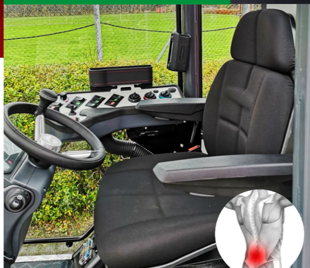
Fuldt justerbart førersæde

Slut med smerter i lænd og ryg. Højdejustering, lænd-støtte og ergonomisk design sikrer dig den mest behagelige oplevelse under brug.