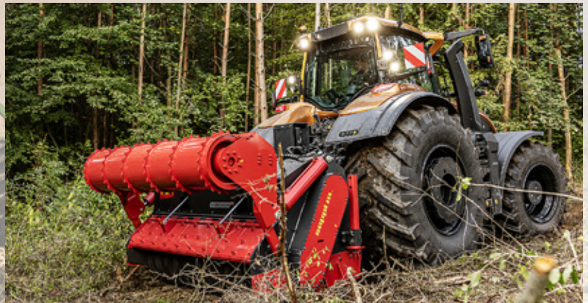
S-serien kan leveres med TwinTrac, bagudvendt kørsel og PowerBoost, så der altid kan opnås fuld effekt, også ved PTO opgaver.

ment og ydeevne via drivlinjen, selv ved lav motorhastighed. Det giver en bedre brændstoføkonomi og lavere driftsomkostninger på den store traktor,” forklarer Aapo Aijasaho.