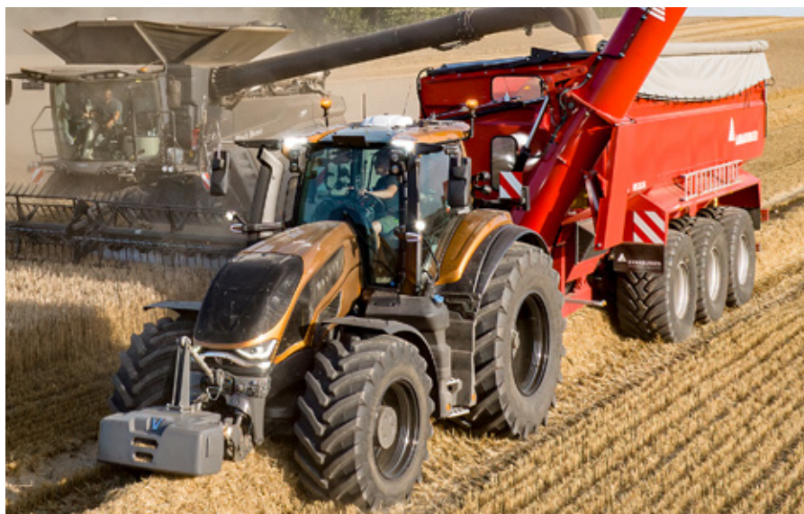
Stylingen af 6. generation kan især ses i designet af motorhjelmen.

Med det nye førerhus er udsyn og komfort blevet endnu bedre. De helt