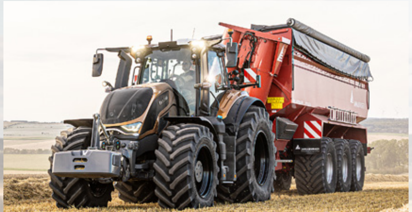
Den nye S-serie blev afsløret i den nye farve Amber Brown.

”Motoren er baseret på den pålidelige AGCO Power-motor på 8,4 liter, men hele indsugningssiden er nyudviklet, så det er muligt at udelade recirkulering af udstødningssgas, samtidig med at både ydeevne og drejningsmoment øges en smule. Motoren er en enhed med såkaldt lave omdrejninger, hvilket betyder, at traktoren får højt drejningsmo-