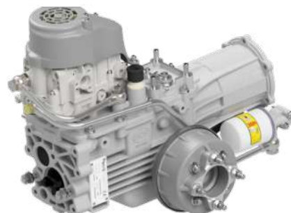
FERRARI 380 HY StarGate