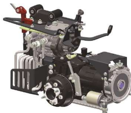
FERRARI 370 HY PowerSafe®