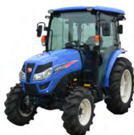
TG 6407G/6507G/6507HST/ 6687HST